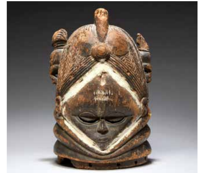
170 MASQUE HEAUME « SOWEI » représentant une femme au cou adipeux et au front incrusté d'un miroir circulaire. La coiffe constituée de nattes révèle quatre petites têtes encadrant une tête plus importante au sommet. Bois à ancienne patine laquée noire. Peuple Mende. Sierra Leone. H : 38 cm 700 / 800 €