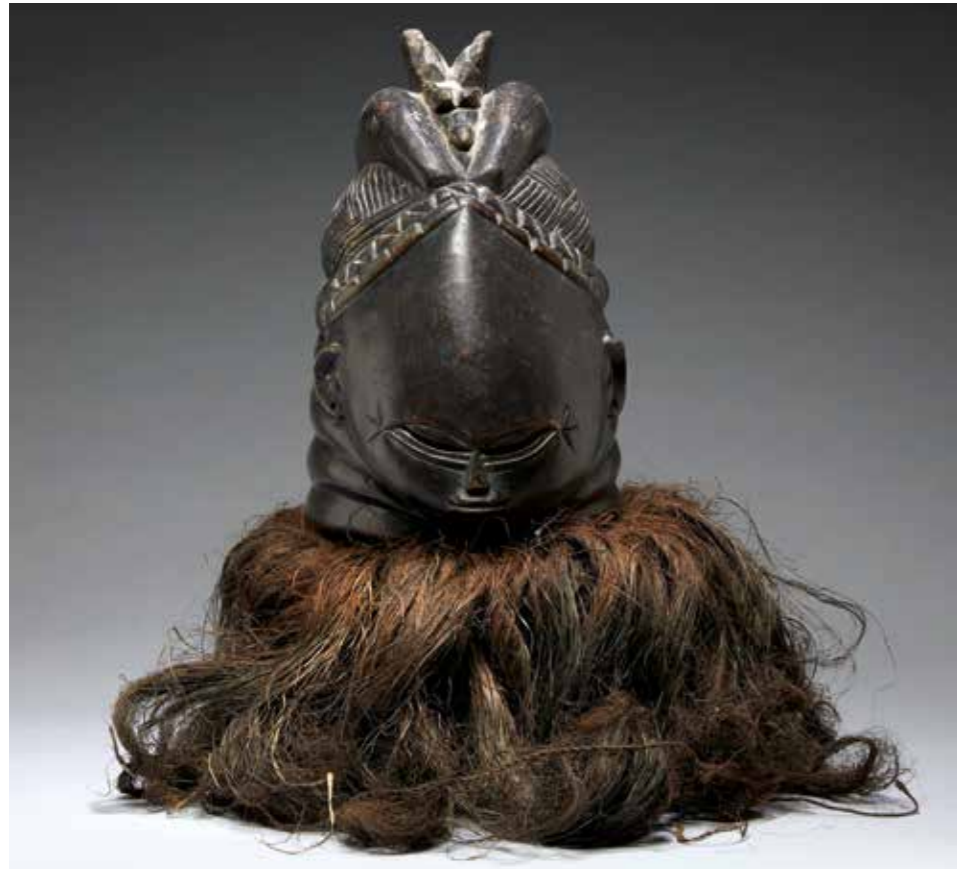
169 MASQUE HEAUME « SOWEI » représentant une femme au cou adipeux et au haut front à coiffure élégante au sein de laquelle se niche un personnage féminin (manque la tête). Parure de crins d'origine. Bois à patine laquée noire. Peuple Mende. Sierra Leone. H : 40 cm 1 000 / 1 500 €