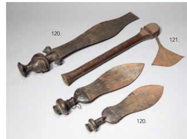
120 DEUX COUTEAUX à poignée ronde en bois à patine brune. Peuple Kuba. République Démocratique du Congo. L : 29 et 34 cm

On joint une épée plate courte à poignée sculptée d'une tête d'oiseau. Peuple Pendé. République Démocratique du Congo. H : 49,5 cm