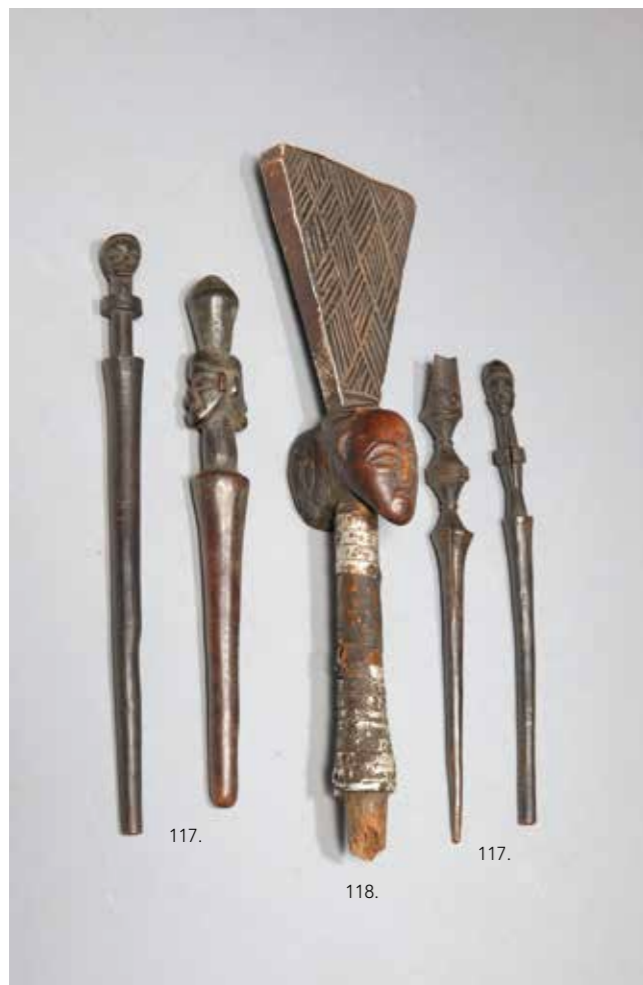
117 QUATRE PIQUES À CHEVEUX en bois dur à patine sombre. Peuple Pendé. République Démocratique du Congo. H : 24 cm 300 / 400 €