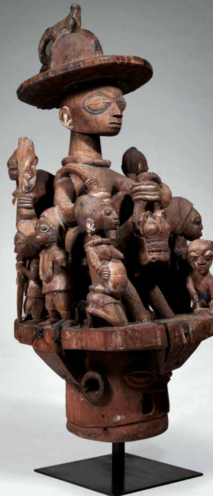
41 SCEPTRE "ESHU" portant des colliers de cauries. Bois à ancienne patine brune. Peuple Yorouba. Nigéria. H : 39 cm (Un sachet de coquillage détaché) 300 / 400 €