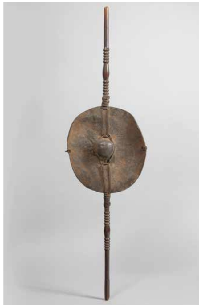
119 BOUCLIER circulaire à renflement central adapté par des ligatures de cuir sur un long bâton sculpté servant de poignée. L'ensemble est recouvert d'une profonde patine d'usage noire laquée. Peuple Nyatulu. Tanzanie. H : 1,38 m Provenance : Galerie Maine Durieu. Paris 1 300 / 1 700 €