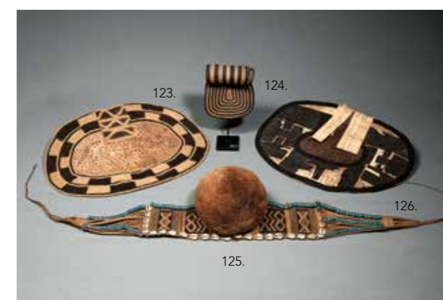
124 CACHE-FESSE pour enfant en fibre tressée de couleur noir et beige. Peuple Mangebetu. République démocratique du Congo. H : 14 cm

Provenance : Galerie Caravane. Bruxelles. 80 / 100 €