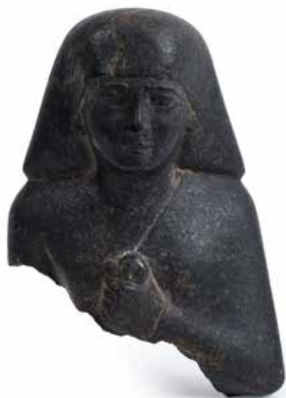
Ce buste fragmentaire provenant d'une statue représentant un dignitaire. Style égyptien, adjugé 29.000€ lors de la vente du 30 mai dernier.