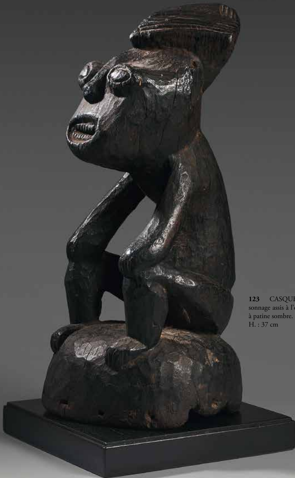
123 CASQUE cimier surmonté d'un personnage assis à l'expression très réaliste - bois à patine sombre. H. : 37 cm