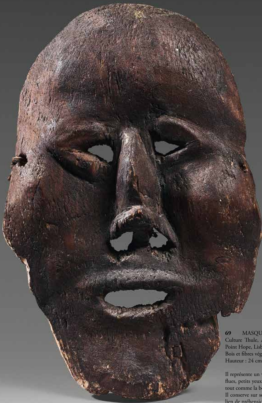
69 MASQUE ESKIMO ANTHROPOMORPHE Culture Thule, Alaska, XVIIème - XVIIIème siècle, récolté in situ à Point Hope, Lisburne peninsula Bois et fibres végétales Hauteur : 24 cm ; Largeur : 15,5 cm

Il représente un visage humain, les pommettes hautes, légèrement joufflues, petits yeux en V pointés vers l'extérieur. Les narines sont percées, tout comme la bouche ovale.