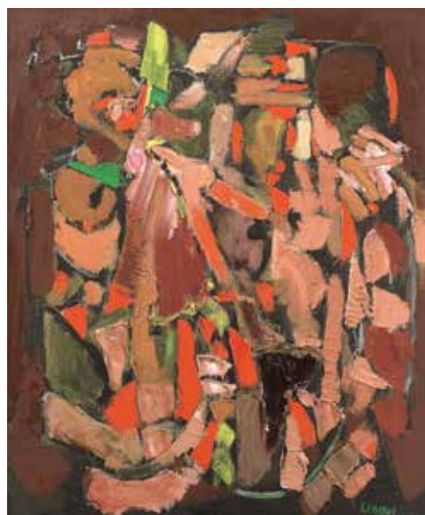
Cette huile sur toile d'André Lansky, «Confirmation» signée en bas à droite, adjugée 19.000€ lors de la vente du 12 juin dernier.