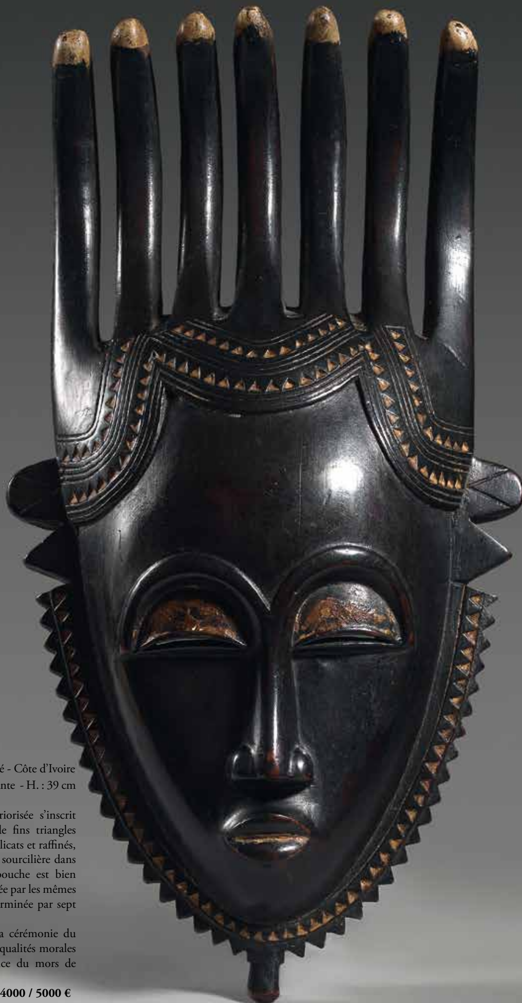
127 MASQUE portrait Baoulé - Côte d'Ivoire Bois dur à patine brun / noir brillante - H. : 39 cm

Ce portrait à l'expression intériorisée s'inscrit dans une collerette travaillée de fins triangles noirs et blancs. Les traits sont délicats et raffinés, les yeux fendus sous une arcade sourcilière dans le prolongement du nez. La bouche est bien dessinée. La chevelure est indiquée par les mêmes motifs que la collerette et est terminée par sept cornes.