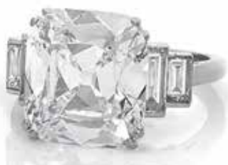
Cette bague Van Cleef & Arpels en or gris, ornée d'un exceptionnel diamant «évoquant l'historique gisement de Golconde» adjugée 400.000€ lors de la vente du 24 octobre dernier.