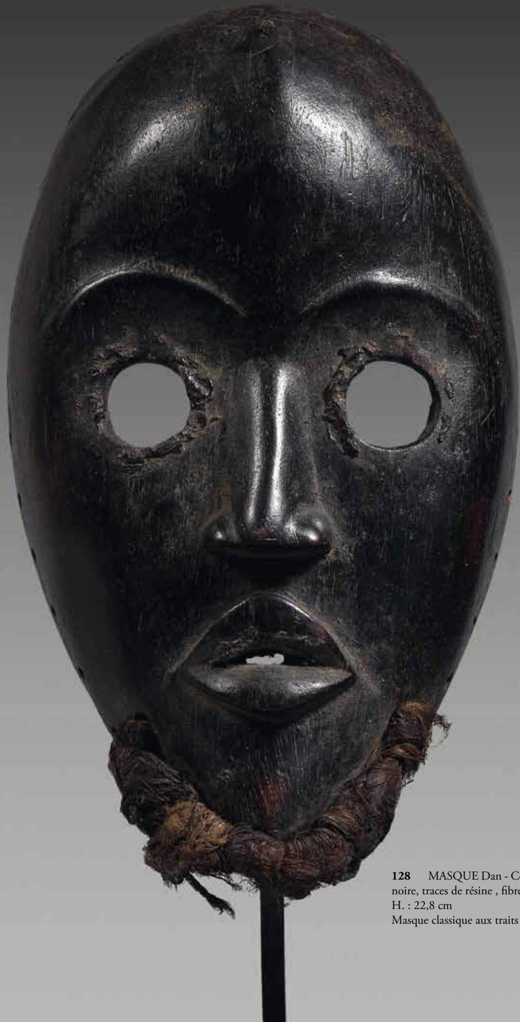
128 MASQUE Dan - Côte d'Ivoire en bois dur à patine noire, traces de résine , fibres végétales et clou sur le front. H. : 22,8 cm Masque classique aux traits fins.