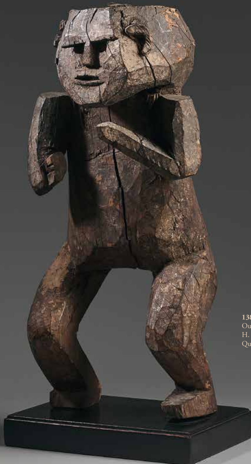
138 STATUE de PROTECTEUR - Ouest Népal H. : 39 cm - Bois dur à patine brune Quelques fentes visibles.