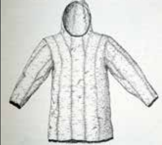
FIG. 10. Hooded parka.

from the back of a number of strips of animal skin, or strips of wool, or strips of paper, or strips of any other material, and of the thickness of medium-sized wrapping paper. The strips are usually of a number 2 or 4 in diameter, and are thus the diameter of the hole made by the needle. The two strips are then wound all up the hole made by the needle. The two strips are then wound with stitches about one to the inch, through and through, in a manner