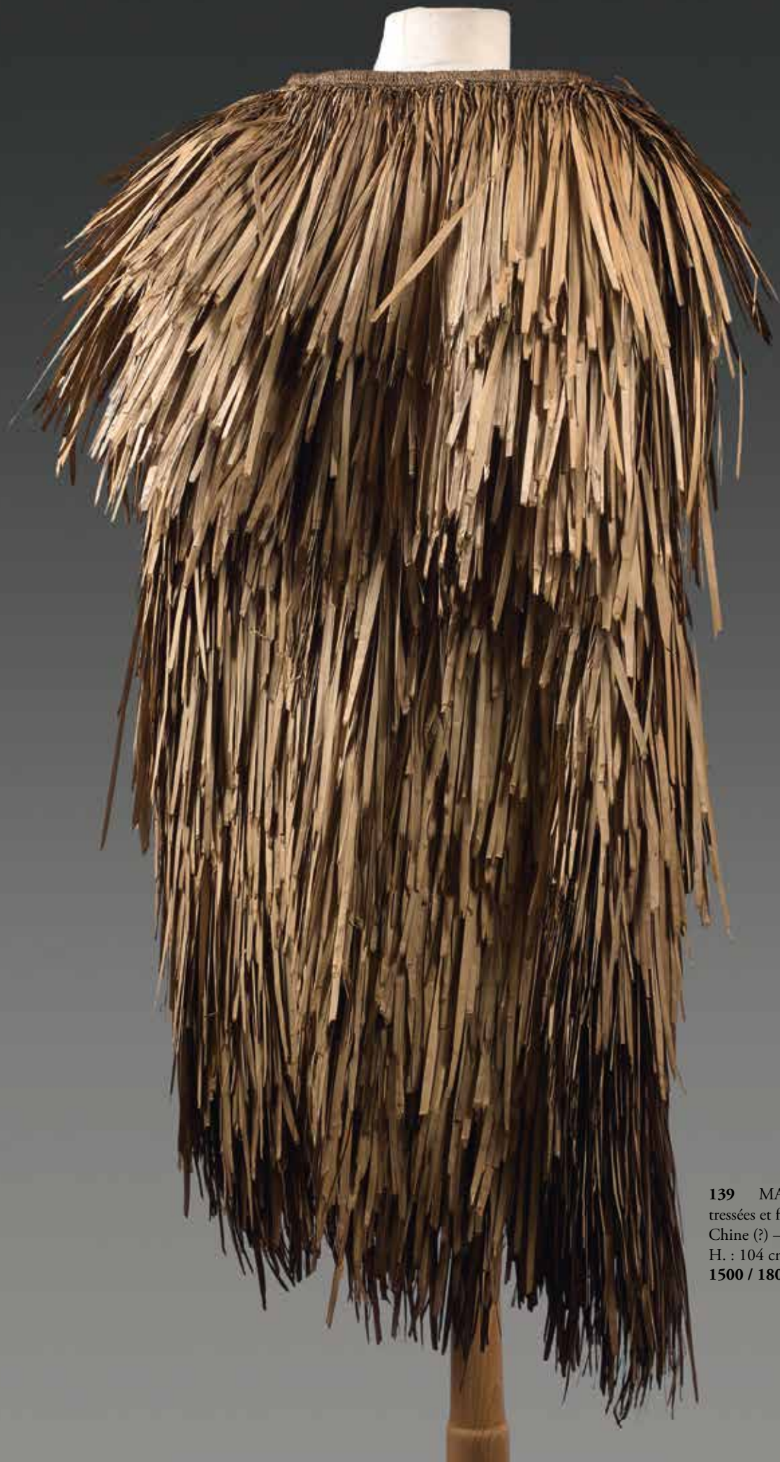
139 MANTEAU de pluie en fibres tressées et feuilles de pandanus. Chine (?) – Japon (?) H. : 104 cm – Larg. : 55 cm 1500 / 1800 €