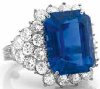
Cette bague en platine ornée d'un superbe saphir, taille émeraude, dans un entourage de 28 diamants taille brillant adjugée 82.000€ lors de la vente du 24 octobre dernier.