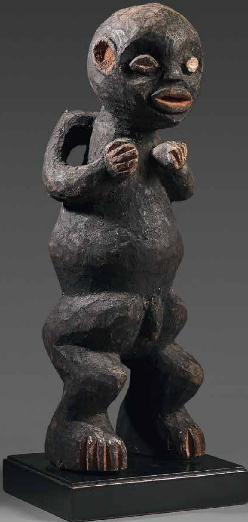
122 STATUE masculine Mambila - Cameroun, les jambes courtes légèrement fléchies, les mains portées sur le haut du buste, la bouche largement ouverte. L'ensemble de la sculpture est réaliste mais pleine d'inventivité. Bois et pigments - H. : 44 cm

Provenance : Ancienne collection privée américaine.